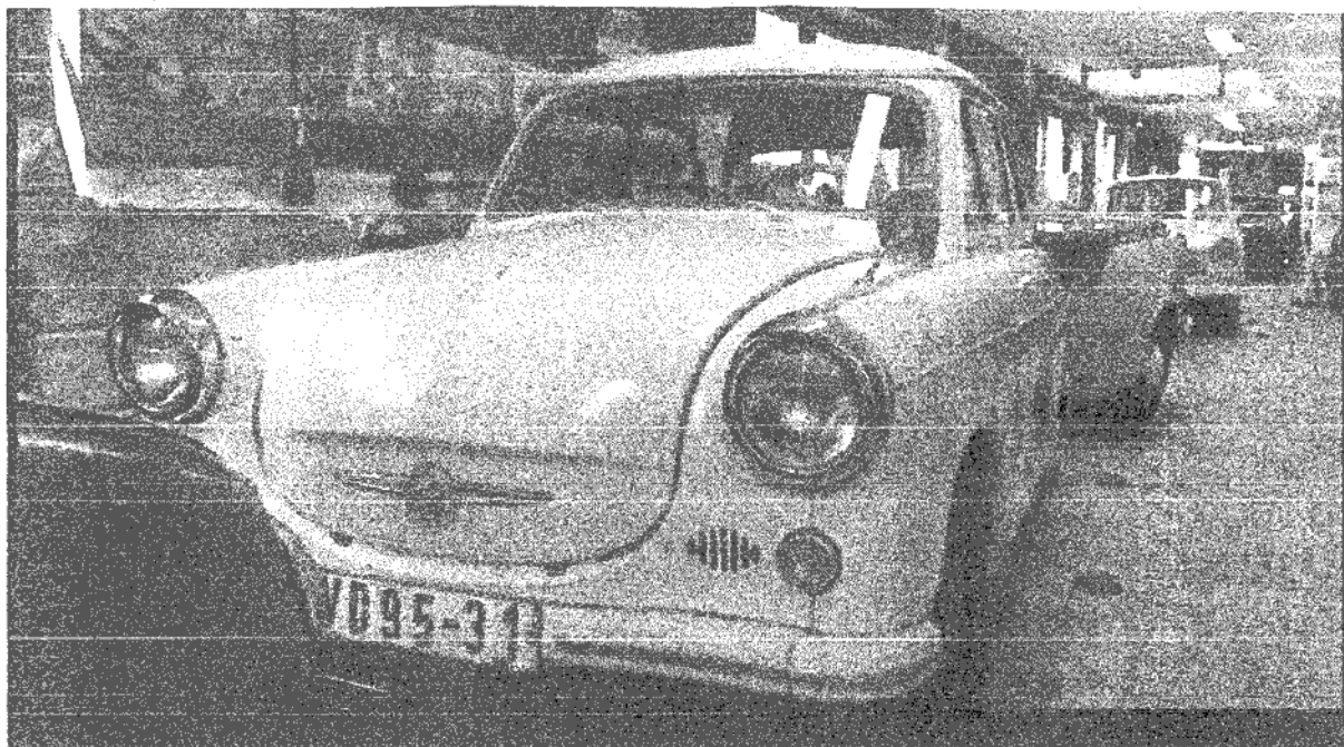
Muzeum Trabantů v Praze

Měsíc poté, co Sovětský svaz vypustil v říjnu 1957 první družici, se vydala na své cesty i jiná technická legenda. Německý výraz Trabant, stejně jako ruské slovo sputnik, totiž označuje družici. První „družice z pryskyřice“ vyjela z továrny ve východoněmeckém Zwickau v den 40. výročí ruské říjnové revoluce, 7. listopadu 1957.